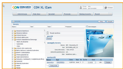
Rys. 2 Klient może wprowadzać nowe zamówienia oraz śledzić stan ich realizacji wraz z dostępem do dokumentów handlowych. Zamówienie wprowadzane z poziomu iZam (Zamówienia Internetowe) automatycznie zapisywane jest w rejestrze zamówień systemu CDN XL.